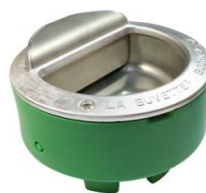
690837-1 Bigcho 2 med svømmer elopvarmet 50W/24V