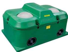
690835 Termolac 75 med 2 bolde frostsikret