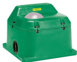
690834 Termolac 40 med 1 bold frostsikret