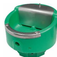
690929 Lakcho 2 med termostat elopvarmet 180W/24V med svømmer