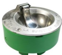
690859 Bigstal 2 med muleklap elopvarmet 50W/24V