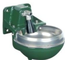
690826 F130-EL elopvarmet 1/2" 30W/24V